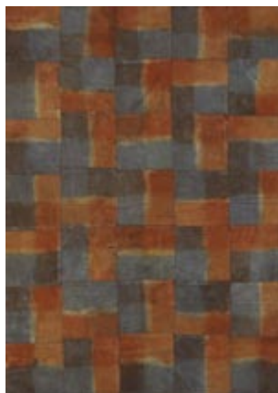
Sans titre [Carrés collés] - 1970 Acrylique sur toile libre découpée assemblée et collée, 269 x 191 cm - Collection particulière © ADAGP Paris 2010