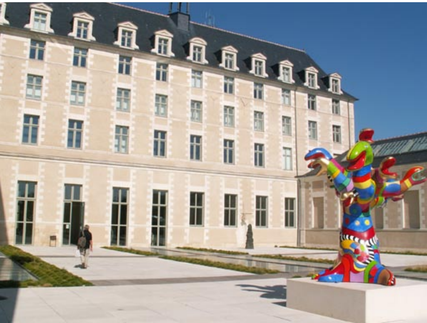
Terrasse du musée des Beaux-Arts

Les musées d'Angers réunissent 5 musées d'art dont la diversité des collections – peintures, sculptures, objets d'art, tapisserie, art textile, antiquités... – témoigne de la richesse artistique de la ville et participe à son rayonnement. Hébergés dans des lieux patrimoniaux uniques, les musées d'Angers accueillent tout au long de l'année des expositions temporaires qui mettent en lumière artistes contemporains et expositions patrimoniales. Une programmation culturelle riche et variée (conférences, spectacle vivant, danse, animations pour les enfants...) propose un autre regard sur le musée qui favorise la croisée des arts et facilite la rencontre avec les œuvres.