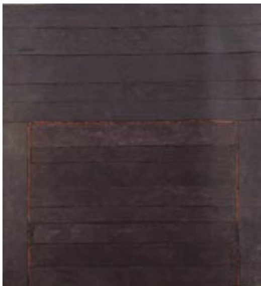
Sans titre [Palissade] - 1974 Acrylique sur toile libre découpée assemblée et collée 317 x 293 cm Collection particulière © ADAGP Paris 2010, photo musées d'Angers / Pierre David