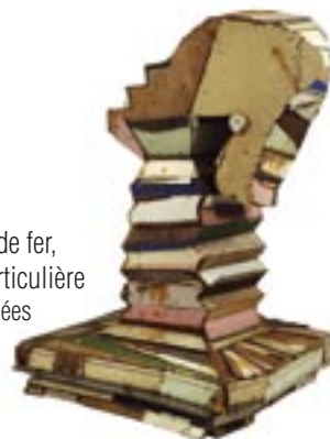
Sans titre , - 1990 Bois peint de récupération, fil de fer, 170 x 110 x 110 cm - Coll. particulière © ADAGP Paris 2010, photo musées d'Angers / Pierre David