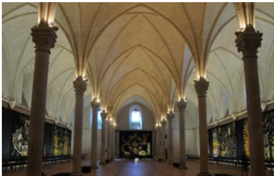
Vue d'ensemble du Chant du Monde de Jean Lurçat