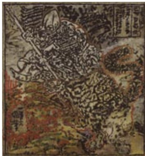
Sans titre [Chasse au tigre] - 2002 Technique mixte sur toile 280 x 260 cm Collection particulière © ADAGP Paris 2010, photo musées d'Angers / Pierre David