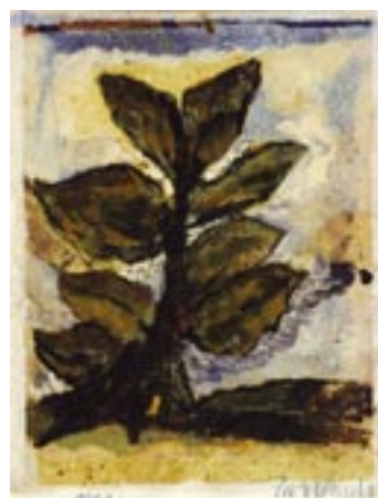
Sans titre - 1997 Technique mixte sur papier 42 x 31 cm Collection particulière © ADAGP Paris 2010, photo musées d'Angers / Pierre David