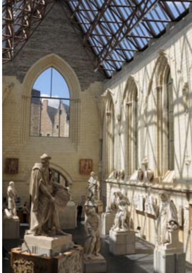
Galerie David d'Angers

Cette réhabilitation architecturale puissante, juxtapose les principes et matériaux de la modernité (structure de fer, emploi du béton et du verre) à ceux du temps passé (emploi du tuffeau et de l'ardoise). L'architecte Pierre Prunet a souhaité préserver le statut de ruine classée Monument Historique du bâtiment en donnant à la lumière une place essentielle.