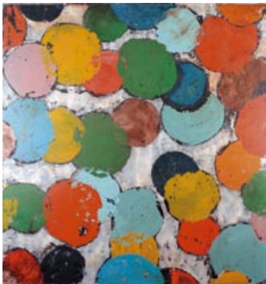
Sans titre 2003 Technique mixte sur toile 220 x 200 cm Collection F. Cazals, Courtesy Denise Cadé Gallery, New York © ADAGP, 2010, photo Jacques Faujour

www.angers.fr/presse - www.facondepenser.com