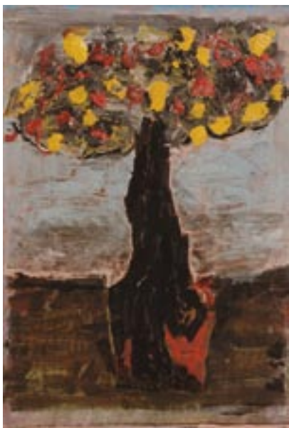
Sans titre [Arbre de la connaissance] - 2002 Technique mixte sur papier 29 x 21,5 cm Collection particulière © ADAGP Paris 2010, photo musées d'Angers / Pierre David