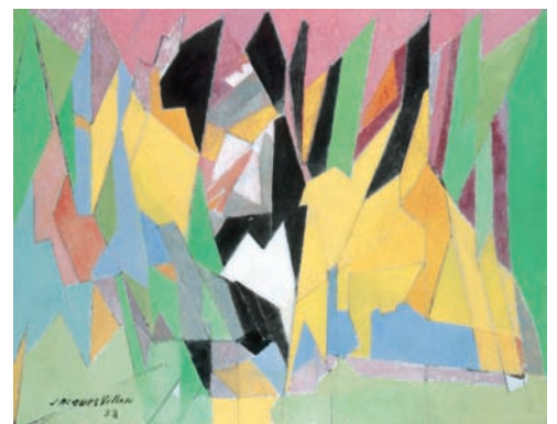
10 Jacques Villon, Le Long du bois , 1958, huile sur toile, 114 x 146 cm Musée d'Art Moderne de la Ville de Paris Adagp Paris 2011