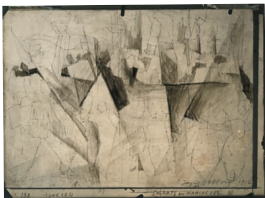
3 Jacques Villon, Soldats en marche , 1912, crayon et lavis d'encre sur tirage photographique, 17,8 x 23,9 cm Paris, Centre Pompidou / Musée national d'art moderne