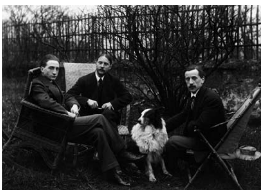
2 Marcel Duchamp, Jacques Villon et Raymond Duchamp-Villon dans le jardin de l'atelier de Puteaux. Vers 1912-1913.