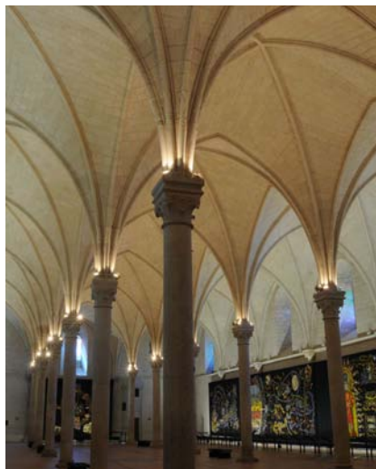
Le Chant du monde de Jean Lurçat.