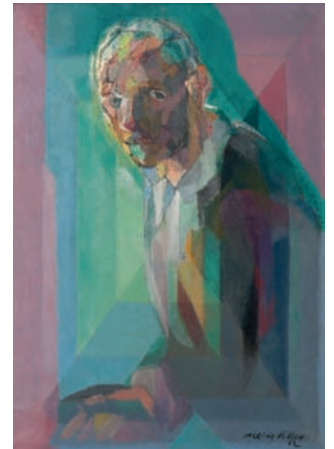
8 Jacques Villon, Portrait de l'artiste , 1942, huile sur toile, 92 x 65 cm New York, collection Shirley Hazzard Steegmuller Photographie D. James Dee Adagp Paris 2011