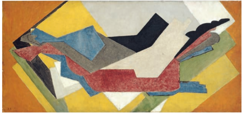
6 Jacques Villon, Cheval de course , 1922, huile sur toile, 46 x 98 cm Collection particulière © Galerie Louis Carré & Cie Adagp Paris 2011