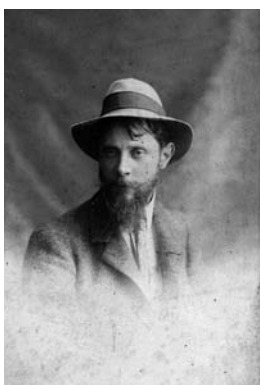
1 Jacques Villon, Vers 1895-1896.