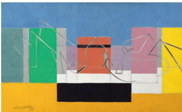
9 Jacques Villon, La Ferme normande , 1953, huile sur toile, 89 x 146 cm Paris, galerie Louis Carré & Cie © Galerie Louis Carré & Cie Adagp Paris 2011