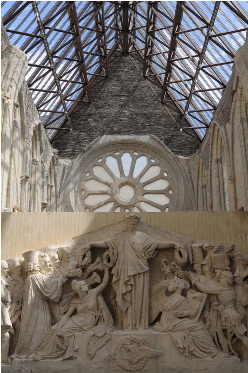
La Galerie David d'Angers.