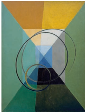
7 Jacques Villon, L'Espace , 1932, huile sur toile, 116 x 89 cm Paris, galerie Louis Carré & Cie