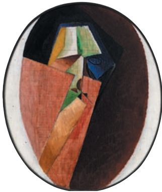
5 Jacques Villon, Tête de femme , 1914, huile et crayon sur toile ovale 55 x 46 cm Providence, Museum of Art, Rhode Island School of Design's Adagp Paris 2011