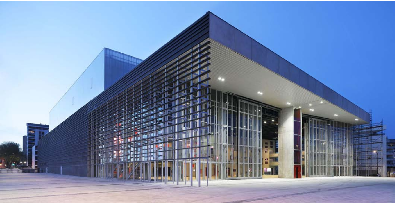
Le Quai.