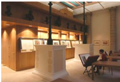
Le cabinet de dessin Jean Bonna

Avec près de vingt mille dessins , le cabinet des dessins conserve, après le musée du Louvre, la collection la plus prestigieuse tant d'un point de vue quantitatif que qualitatif. Constitué de feuilles exceptionnelles, où les maîtres tels Léonard de Vinci, Raphaël, Rubens, Poussin ou Boucher se côtoient , le fonds couvre une période très large allant de la Renaissance à nos jours et rassemble une grande diversité de sujets et de genres : histoire ancienne, religieuse ou mythologique, portraits, paysages... Quelques-unes des plus belles pièces proviennent de dons importants de généreux collectionneurs, notamment Jacques-Edouard Gatteaux (1883), Jean Masson (1925), ou encore Mathias Polakovits (1987).