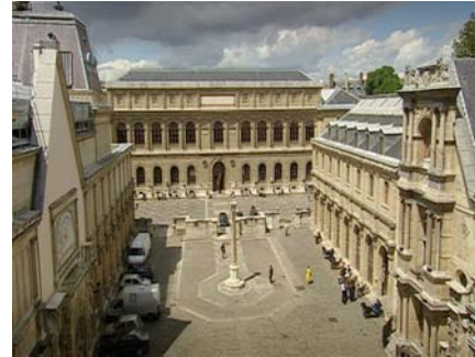
L'École des Beaux-Arts dans le 6 e arrondissement

Etablissement placé sous la tutelle du ministère de la Culture et de la Communication, l'École nationale supérieure des beaux-arts dispense une formation artistique combinant savoir-faire et connaissances théoriques, classiques et contemporaines. Afin que les étudiants deviennent de véritables artistes, l'institution privilégie un travail en ateliers (moulage, vitrail, technique de la peinture...) dans lesquels les élèves sont soutenus et encadrés par des professeurs spécialisés, artistes internationalement reconnus. La création récente d'un pôle numérique et le développement des secteurs multimédias permettent aux étudiants de maîtriser les nouvelles technologies aujourd'hui incontournables dans le domaine de la création (image de synthèse, son, vidéo).