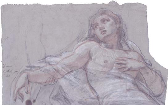
Dessin d'Antoine-François Callet

L'École des beaux-arts conserve une collection très importante de dessins français du XVIII e siècle, de Pierre Antoine Watteau à Jean-Honoré Fragonard. Présenté à plusieurs reprises, notamment en 2003 lors de l'exposition consacrée à François Boucher et l'art rocaille, ce fonds très riche mérite d'être étudié et régulièrement montré au public. C'est le cas cette année avec les dessins d'Antoine François Callet,