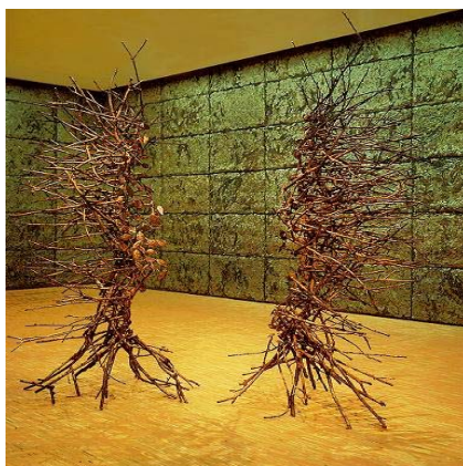
Giuseppe Penone, Peau de feuilles

Né en 1947 à Garessio, Giuseppe Penone est un artiste contemporain. Il est un des chefs de file de l'Arte Povera, mouvement né dans les années 60. Dès 1968, Giuseppe Penone se fait remarquer sur la scène internationale par son travail cherchant à mettre en relation le monde végétal et le corps. Il enseigne à l'École des Beaux-Arts depuis 1997.