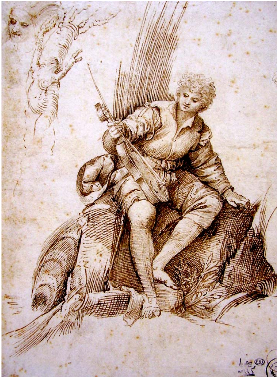
Giulio Campagnola (Padoue vers 1482 – Venise vers 1515/1510) – Le Joueur de viole, plume, encre brune, Inv.n°EBA 61)