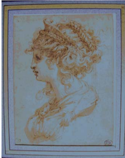
Dessin de Francesco Salviati

Cette exposition consacrée au dessin florentin de la Renaissance est une occasion rare de redécouvrir les chefs-d'œuvre des collections italiennes de l'École des beaux-arts. Une trentaine de feuilles dues aux plus grands artistes tels que Michel-Ange, Andrea del Sarto, Baccio Bandinelli, Jacopo Pontormo, Francesco Salviati, Giorgio Vasari, Perino del Vaga, etc. y seront réunies. Foyer intellectuel et artistique de premier plan, Florence est en proie dans la première moitié du XVI e siècle à une instabilité politique – entre le déclin des Médicis et la proclamation de la République – qui génère un climat d'inquiétude et précipite la remise en cause de l'idéal classique. S'ouvre une fructueuse période d'expérimentation emmenée par Michel-Ange et sa très grande liberté d'invention. C'est cette passionnante époque de transition entre le style classique et la naissance du maniérisme que dévoile l'exposition. Cette confrontation d'œuvres dessinées des contemporains de Michel-Ange permet également de mesurer l'impact libérateur de l'art de Michel-Ange sur les générations suivantes de sculpteurs et peintres florentins.