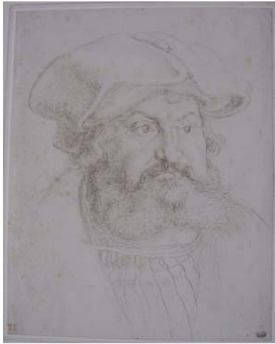
Albrecht Dürer, Portrait de Frédéric de Saxe